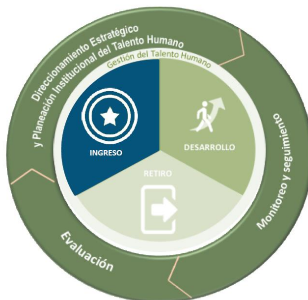
ILUSTRACIÓN 2.-SUBCOMPONENTES Y CATEGORÍAS DE LA POLÍTICA GETH