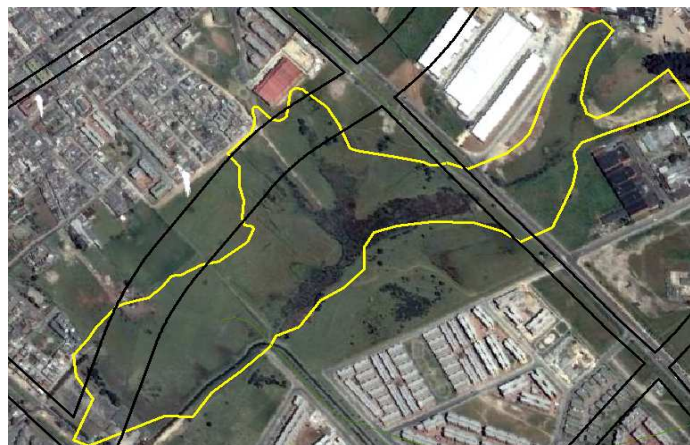
Localización geográfica y político-administrativa del Humedal Capellania. CIC/EAAB (2006).