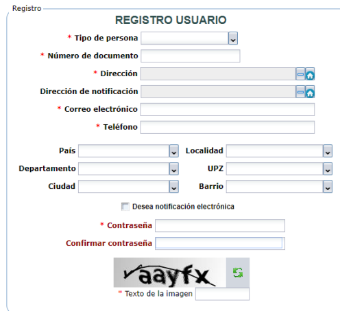
Figura 2. Registro de usuario. Aplicativo web SDA

En caso de que la empresa -constructora ya tenga usuario, pero haya olvidado la contraseña, la dependencia competente para ayudar a restablecerla es la Dirección de Planeación y Sistemas de Información Ambiental -DPSIA-, quienes tienen los profesionales competentes en el manejo de sistemas. Para comunicarse con dicha área debe llamar al teléfono 3778899 ext. 8813.