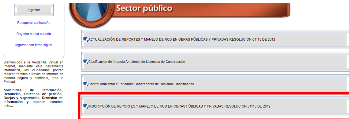
Figura 4. Inscripción de generador y proyecto. Aplicativo web SDA