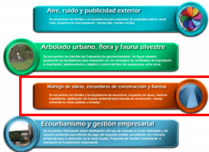
Figura 3. Ingreso al aplicativo web SDA